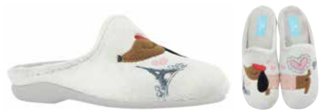
02849 Nala lieferbar Anfang 07.2025 Weite G , Veloursmaterial, Plüschfutter, Verzierung Hund, Wechselfußbett, Gummisohle Farben & Größen: 61 grau: 35 - 42