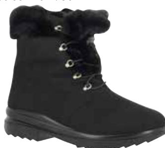
46422 Luise lieferbar Mitte 09.2025

Weite K , Microvelours, Schurwollfutter , Pelzkragen , Varotex-Membrane, Schnürung, Reißverschluss, PU-Sohle