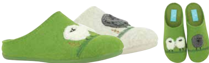
02844 Fina lieferbar Anfang 07.2025 Weite G , Filzmaterial, Verzierung Schafe, Wechselfußbett, Gummisohle Farben & Größen: 18 pistazie, 30 natur: 35 - 42