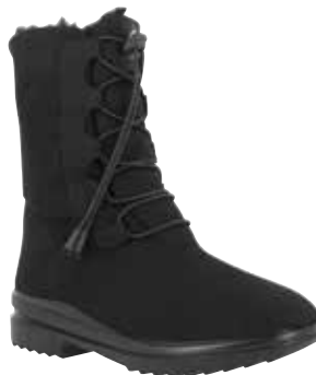
46521 Astrid lieferbar Mitte 09.2025

Weite K , Microvelours, Schurwollfutter , Pelzkragen , Varotex-Membrane, Reißverschluss, PU-Sohle