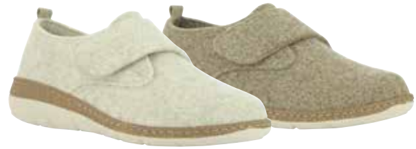
13221 Wenke lieferbar Anfang 08.2025 Weite H , Filzmaterial, Klettverschluss, Wechselfußbett, PU-Sohle Farben & Größen: 30 natur, 50 braun: 36 - 42