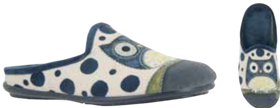
02836 Owlina lieferbar Anfang 07.2025 Weite G , Veloursmaterial, Filzfutter, Verzierung Eule, Wechselfußbett, Gummisohle Farben & Größen: 25 marine: 36 - 42