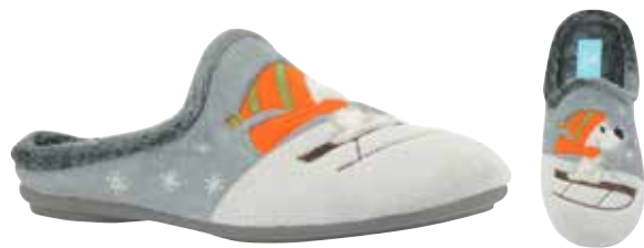
02848 Rosie lieferbar Anfang 07.2025 Weite G , Veloursmaterial, Plüschfutter, Verzierung Beagle, Wechselfußbett, Gummisohle Farben & Größen: 61 grau: 35 - 42