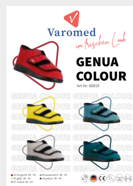
Pappaufsteller DIN A4