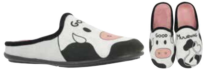
02838 Cowzy lieferbar Anfang 07.2025 Weite G , Veloursmaterial, Filzfutter, Aufdruck Kuh, Wechselfußbett, Gummisohle Farben & Größen: 670 schwarz-weiß: 36 - 42