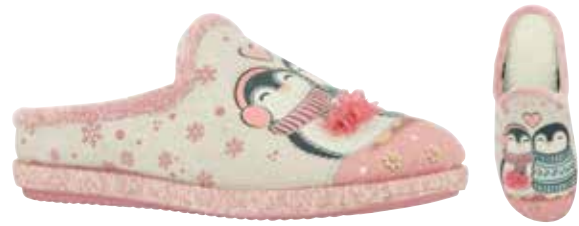
02840 Eira lieferbar Anfang 07.2025 Weite G , Veloursmaterial, Moltonfutter, Aufdruck Pinguin, Wechselfußbett, Gummisohle Farben & Größen: 05 rosa: 36 - 41