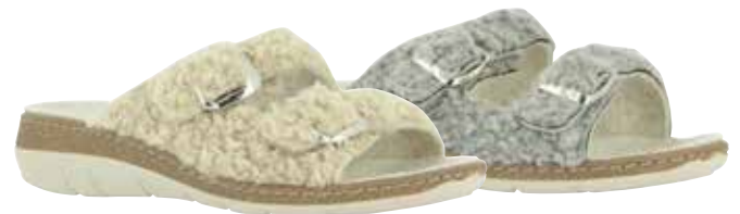
13741 Effy lieferbar Anfang 08.2025 Weite H , Teddyplüsch, Filzfutter, Klettverschlüsse, Zierschnallen, Wechselfußbett, PU-Sohle Farben & Größen: 31 beige, 61 grau: 36 - 42