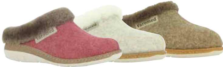
13711 Leni lieferbar Anfang 08.2025 Weite H , Filzmaterial, Lammfell-Kragen, Wechselfußbett, PU-Sohle Farben & Größen: 08 beere, 30 natur, 50 braun: 36 - 42