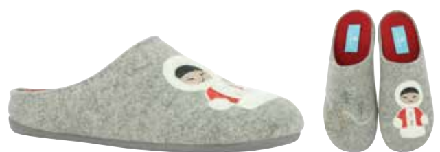
02846 Kaya lieferbar Anfang 07.2025 Weite G , Filzmaterial, Verzierung Inuit, Wechselfußbett, Gummisohle Farben & Größen: 61 grau: 35 - 42