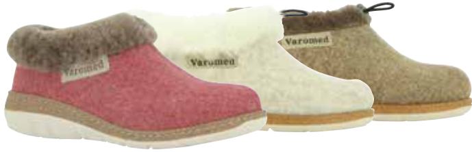
13211 Cleo lieferbar Anfang 08.2025 Weite H , Filzmaterial, Lammfell-Kragen, Wechselfußbett, PU-Sohle Farben & Größen: 08 beere, 30 natur, 50 braun: 36 - 42