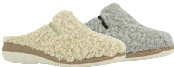
13731 Tiffany lieferbar Anfang 08.2025 Weite H , Teddyplüsch, Filzfutter, Gummizüge, Wechselfußbett, PU-Sohle Farben & Größen: 31 beige, 61 grau: 36 - 42