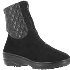
50414 Camilla lieferbar Mitte 09.2025

Weite H , Microvelours/Technomaterial, Schurwollfutter , Varotex-Membrane, Reißverschluss, Gummizug, PU-Sohle