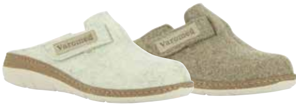
13721 Sophie lieferbar Anfang 08.2025 Weite H , Filzmaterial, Klettverschluss, Wechselfußbett, PU-Sohle Farben & Größen: 30 natur, 50 braun: 36 - 42