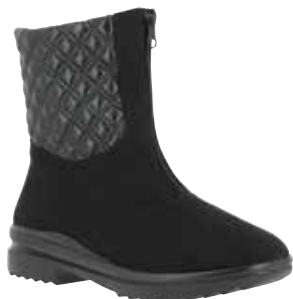
46411 Senta lieferbar Mitte 09.2025

Weite K , Microvelours/Technomaterial, Schurwollfutter , Varotex-Membrane, Reißverschluss, PU-Sohle