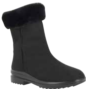
46472 Isla lieferbar Mitte 09.2025

Weite K , Microvelours, Schurwollfutter , Pelzkragen , Varotex-Membrane, Reißverschluss, PU-Sohle