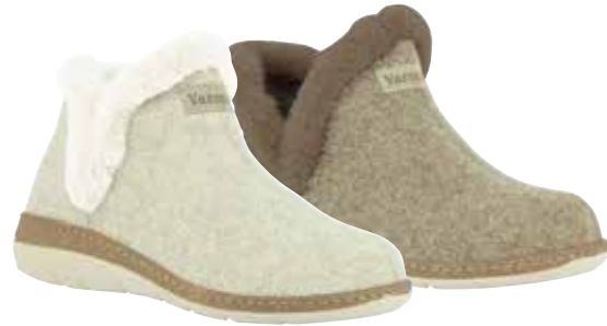
13511 Gina lieferbar Anfang 08.2025 Weite H , Filzmaterial, Lammfell-Kragen, Wechselfußbett, PU-Sohle Farben & Größen: 30 natur, 50 braun: 36 - 42