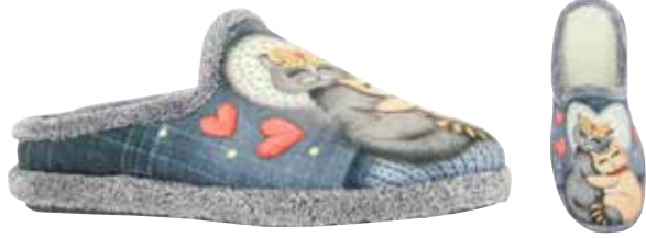
02839 Kitty lieferbar Anfang 07.2025 Weite G , Veloursmaterial, Moltonfutter, Aufdruck Katzen, Wechselfußbett, Gummisohle Farben & Größen: 23 jeans: 36 - 41